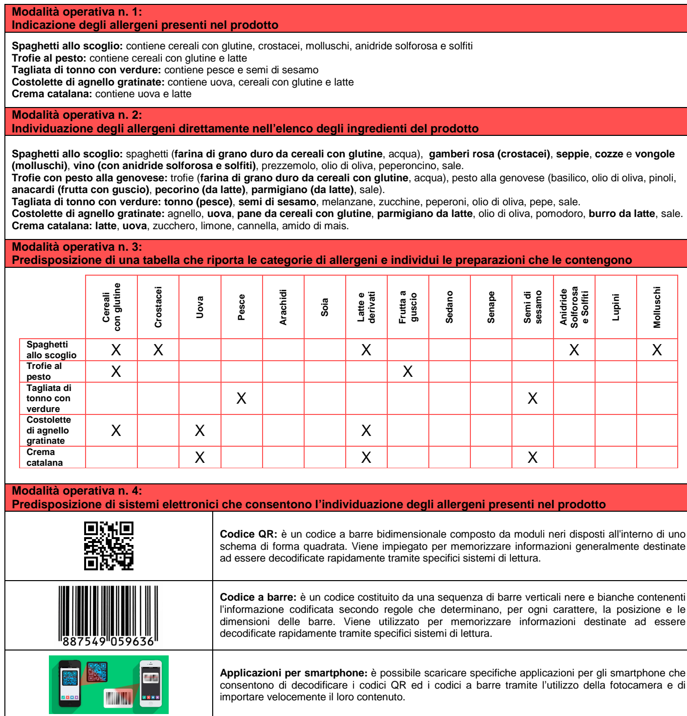
Tabella 1 – Modalità di informazione della presenza di allergeni negli alimenti pronti per il consumo

operative da adottare per garantire la corretta indicazione degli allergeni presenti negli alimenti pronti al consumo. La scelta circa la modalità da utilizzare per informare il consumatore finale è rimessa alla discrezionalità dell'operatore alimentare che sceglierà la soluzione più idonea ed efficace a seconda dell'organizzazione e della dimensione aziendale. È ammesso l'impiego di mezzi informatici (es. QR code, codici a barre, applicazioni per smartphone) i quali però devono essere sempre accompagnati da ulteriori strumenti informativi in quanto non facilmente accessibili a tutta la popolazione. Qualora nell'impresa alimentare fossero utilizzati vari allergeni e non fosse possibile garantire l'assenza di contaminazioni crociate durante lo svolgimento delle lavorazioni, si suggerisce di fare presente verbalmente o per iscritto (cartelli, registri, menù) al consumatore che tali sostanze possono essere presenti in tracce in tutti i prodotti anche se non espressamente indicati nelle singole preparazioni.