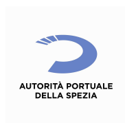
Autorità Portuale della Spezia